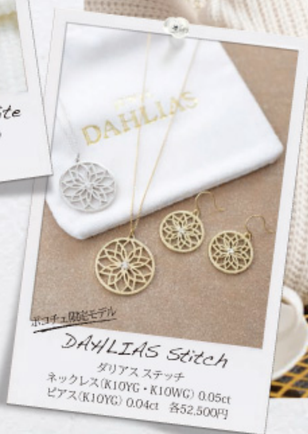
ポコチュ限定モデル DAHLIAS Stitch ダリアスステッチ ネックレス(K10YG・K10WG) 0.05ct ピアス(K10YG) 0.04ct 各52,500円