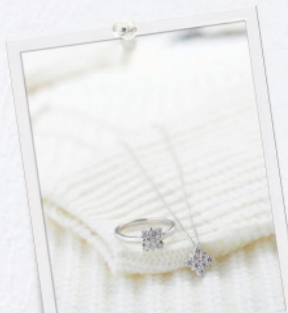
DAHLIAS Snow White ダリアススノーホワイト(K18WG) リング0.17ct 115,500円 ネックレス0.19ct 84,000円