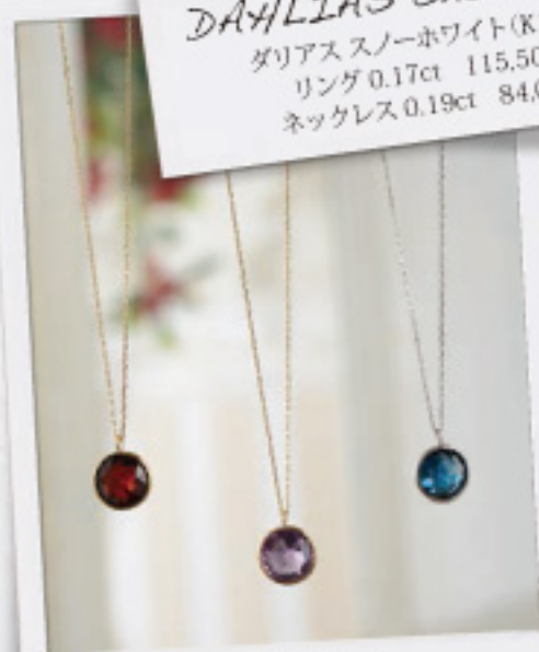
DAHLIAS Colour ダリアスカラー ガーネット、アメジスト、ロンドンブルー トパーズ 各20,000円